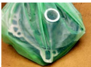
BOSELON 601 Beutel